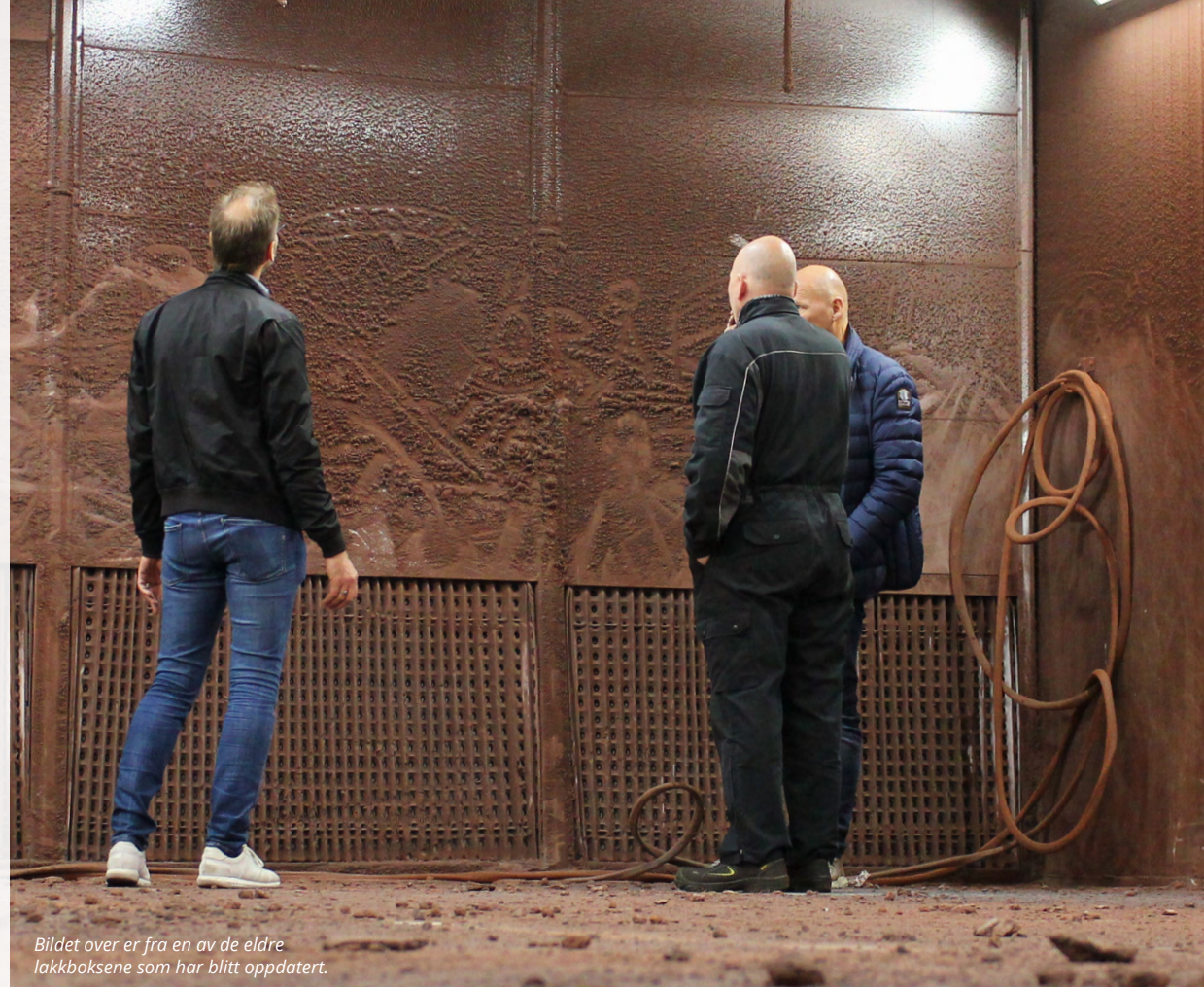
Bildet over er fra en av de eldre lakkboksene som har blitt oppdatert.